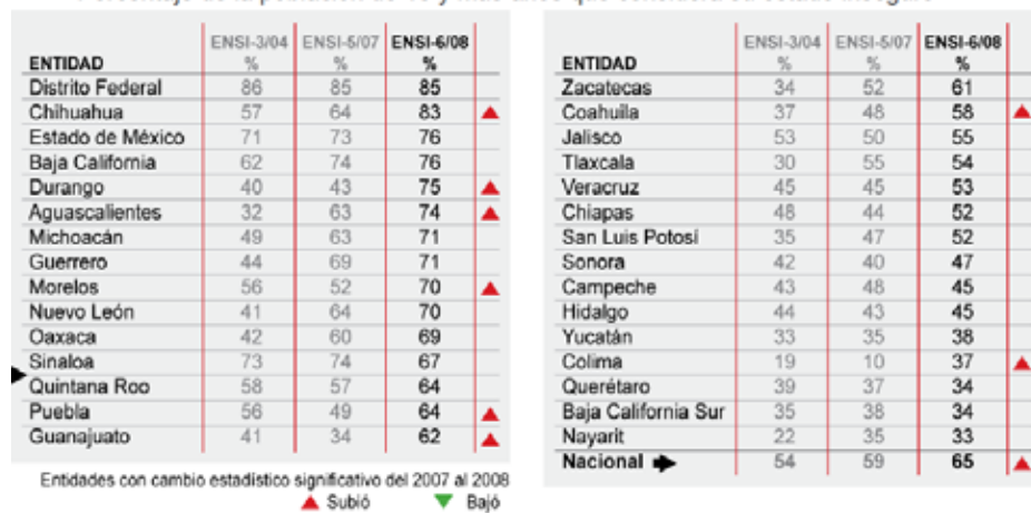
Porcentaje de la población de 18 y más años que considera su estado inseguro

Por temor a la delincuencia, varios hábitos de las y los mexicanos se han visto modificados