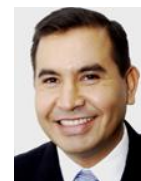
Integrante Sen. David Jiménez Rumbo