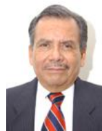
Integrante Sen. Heladio Ramírez López