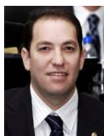
Integrante Sen. Jorge Legorreta Ordorica