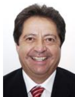
Integrante Sen. José Isabel Trejo Reyes