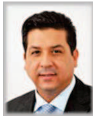
Sen. Francisco García Cabeza de Vaca SECRETARIO