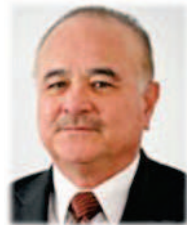
Sen. Ernesto Ruffo Appel INTEGRANTE