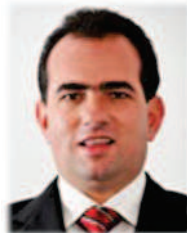
Sen. José Francisco Yunes Zorrilla INTEGRANTE