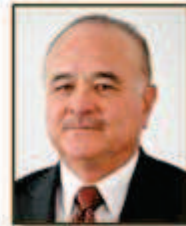
Sen. Ernesto Ruffo Appel