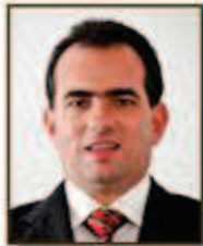
Sen. José Francisco Yunes Zorrilla