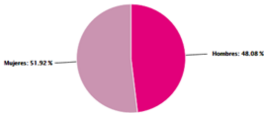
Distribución de Ciudadanos por sexo Lista Nominal