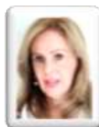
Sen. María Elena Barrera Tapia México