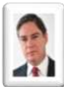
Sen. Fernando Enrique Mayans Canabal Tabasco