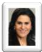
Sen. María Elena Barrera Tapia México