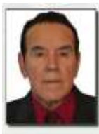
Sen. Armando Neyra Chávez Lista Nacional