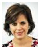
Sen. Hilda Esthela Flores Escalera