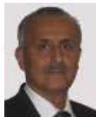
Sen. Carlos Manuel Merino Campos Tabasco