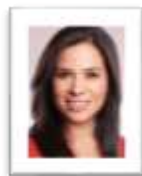
Sen. Anabel Acosta Islas Sonora