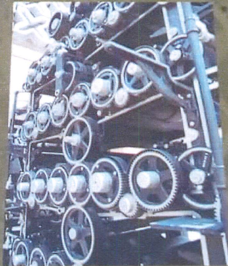
Engranajes de la Rotativa Constituyente

En octubre de 1986, el periódico El Universal, donó a la LXIII Legislatura del H. Congreso de la Unión la rotativa donde se imprimió la primera edición de la Constitución Política de los Estados Unidos Mexicanos de 1917. Fue fabricada por la compañía The Goss Printing Press de Chicago, Illinois, U.S.A.