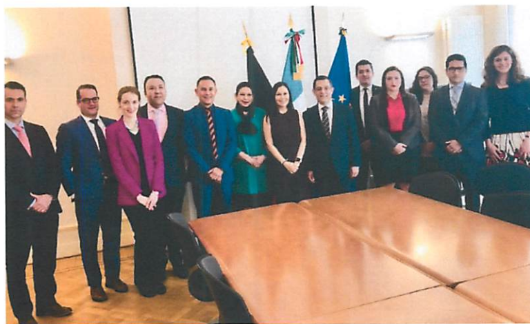
Senadora Laura Angélica Rojas Hernández y el Excmo. Sr. Embajador Mauricio Figueroa, durante la visita de trabajo al Parlamento Europeo.

La Senadora Laura Rojas fue recibida y acompañada a sus reuniones de trabajo por el Excmo. Sr. Mauricio Escanero Figueroa, Embajador de México ante el Reino de Bélgica y el Gran Ducado de Luxemburgo, y Representante de México ante la Unión Europea.