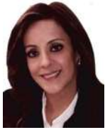
SEN. YOLANDA DE LA TORRE VALDEZ