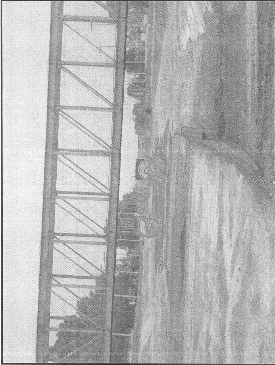
SE MUESTRA VASO REGULADOR LIMPIO, EL CUAL SE LOCALIZA ENTRE EL EJE 1 NORTE Y LA AV. DEL PEÑÓN, COLONIAS REVOLUCIÓN Y AZTECA, DELEGACIÓN VENUSTIANO CARRANZA.

A handwritten signature or mark in the bottom right corner of the page, consisting of a stylized, cursive letter 'P'.