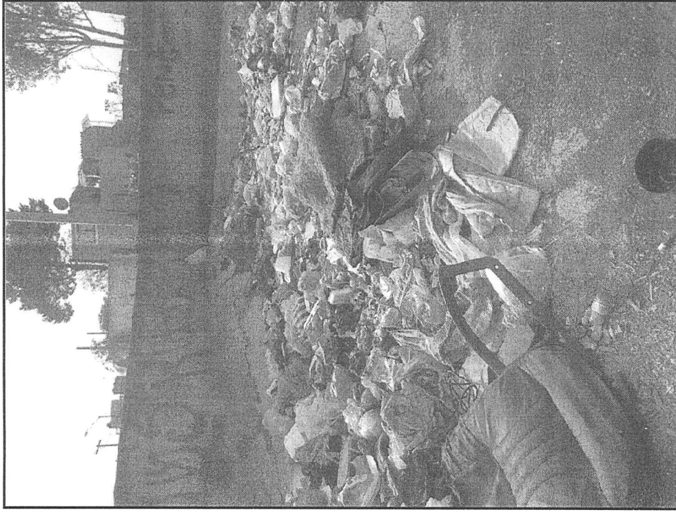
SE MUESTRA BASURA DENTRO DEL VASO REGULADOR, LA CUAL FUE ARROJADA POR LOS MISMOS VECINOS DE LAS COLONIAS AZTECA Y REVOLUCIÓN, DELEGACIÓN VENUSTIANO CARRANZA.