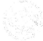
Cuadro 1. Relación de Contratos del TIMT