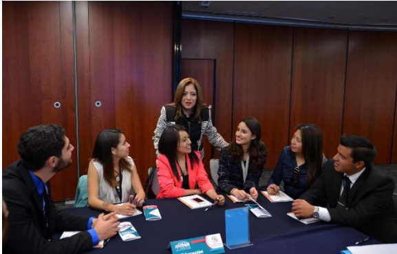
Foro "Jóvenes y Familia". Mayo de 2017.