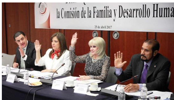
15ª Reunión Ordinaria. 25 de abril de 2017