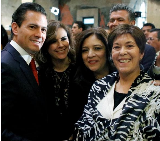
Sesión Solemne. 6 de diciembre de 2017.