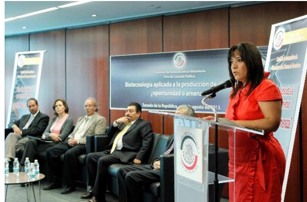
Foro de Consulta "Biotecnología aplicada a la producción de Alimentos". 15 de agosto de 2013.