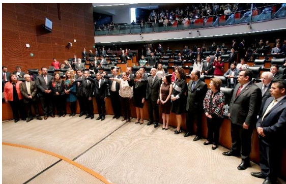
Sesión Ordinaria. 1 de marzo de 2018.