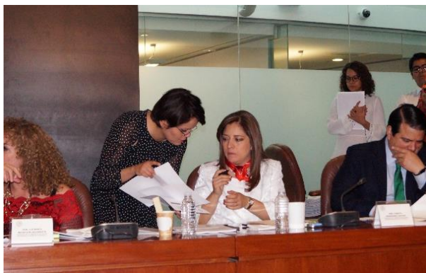
Reunión de Trabajo. 25 de abril de 2017.