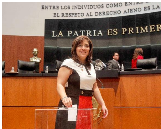
Sesión Ordinaria. 7 de noviembre de 2013.