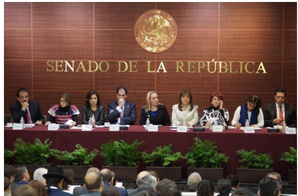
Inauguración del 7° Foro del FPH. 9 de noviembre de 2016.