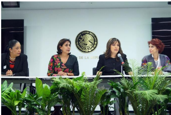
Conferencia de prensa. 8 de noviembre de 2016.