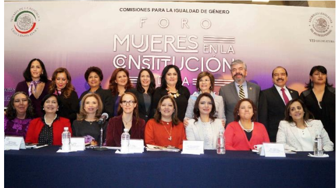
Foro "Mujeres en la Constitución". Febrero 2016.