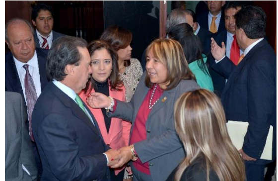
Sesión Ordinaria. 18 de septiembre de 2013.