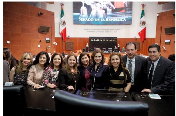
Sesión Ordinaria. 22 de febrero de 2018.