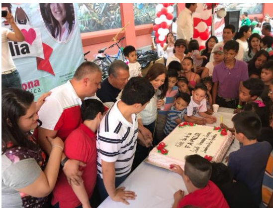
Día Nacional de la Familia