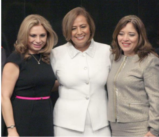
Sesión Solemne. 8 de marzo de 2016.