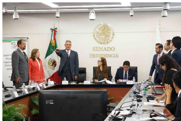
Reunión de Trabajo. 25 de abril de 2016.