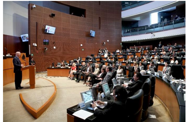
Sesión Solemne. 28 de marzo de 2017.