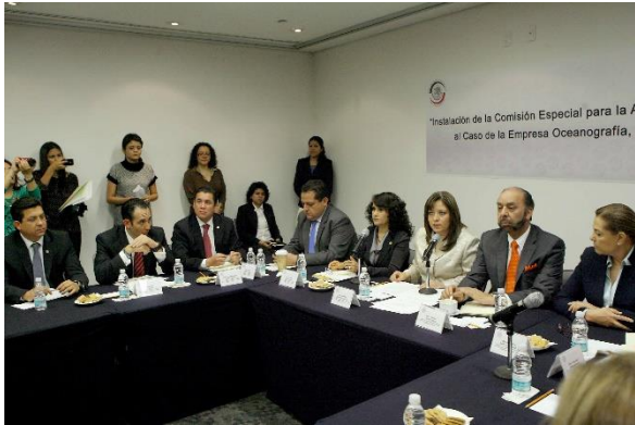
Reunión de Instalación. 3 de abril de 2014