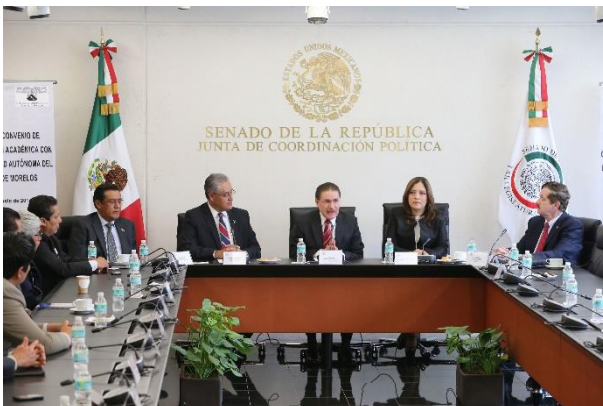
Firma del Convenio con la UAEM. Agosto 2014.