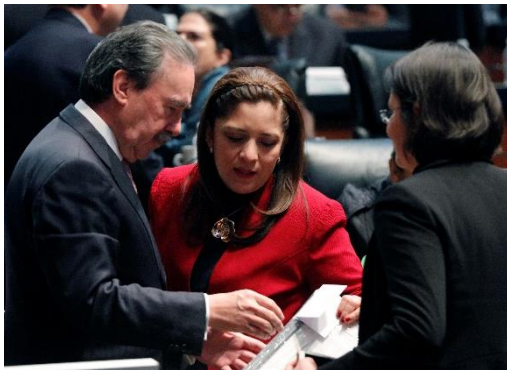
Sesión Ordinaria. 14 de diciembre de 2017.