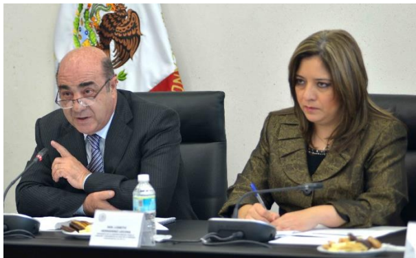
Reunión de Trabajo. 20 de junio de 2014