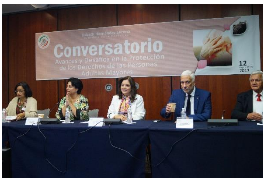
Conversatorio. 12 de septiembre de 2017