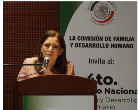
4º Congreso de Familia. 14 de marzo de 2018