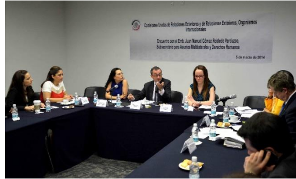
Reunión de Trabajo. 5 de marzo de 2014.