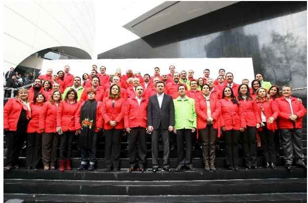
VIII Reunión Plenaria del GPPRI. Enero 2016.