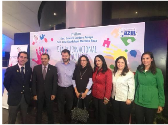
Día Internacional del Autismo