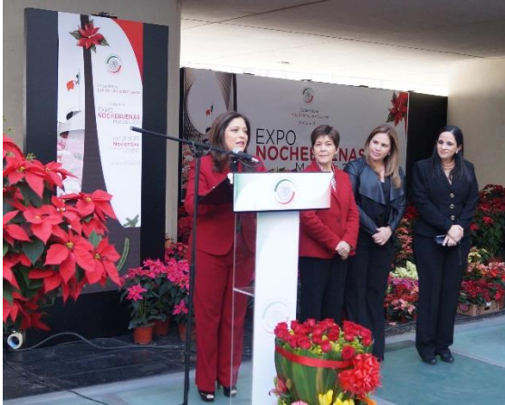
Expo Nochebuenas. Noviembre de 2017.