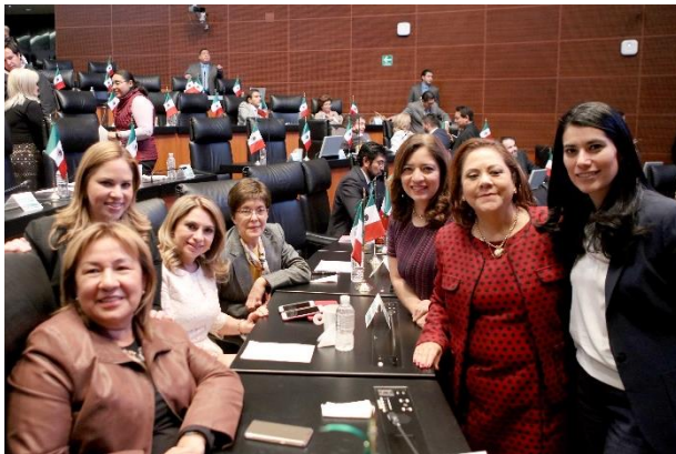
Sesión Ordinaria. 8 de febrero de 2017.