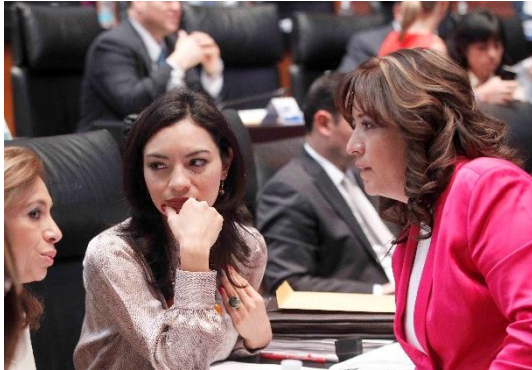
Sesión Ordinaria. 12 de septiembre de 2013.