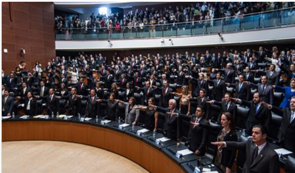
Sesión Ordinaria del Senado de la República de fecha 4 de abril de 2018.