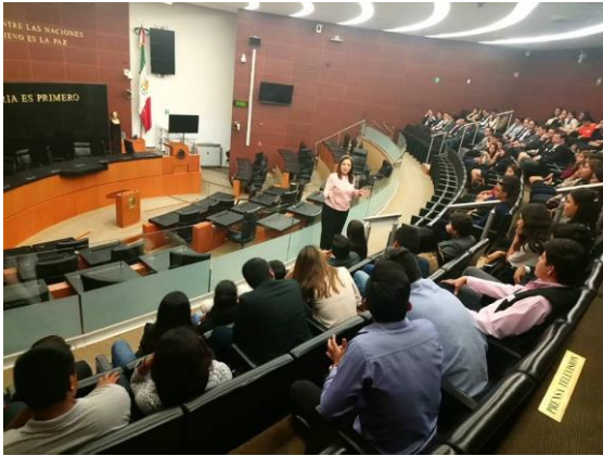
Visita guiada en el Senado de la República.