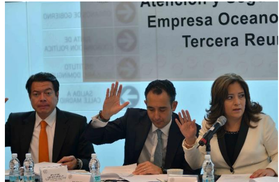
Reunión de Trabajo. 11 de junio de 2014