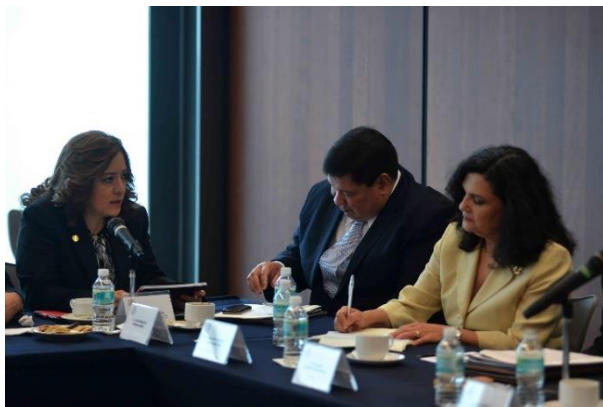
Reunión de Trabajo. 12 de marzo de 2015.