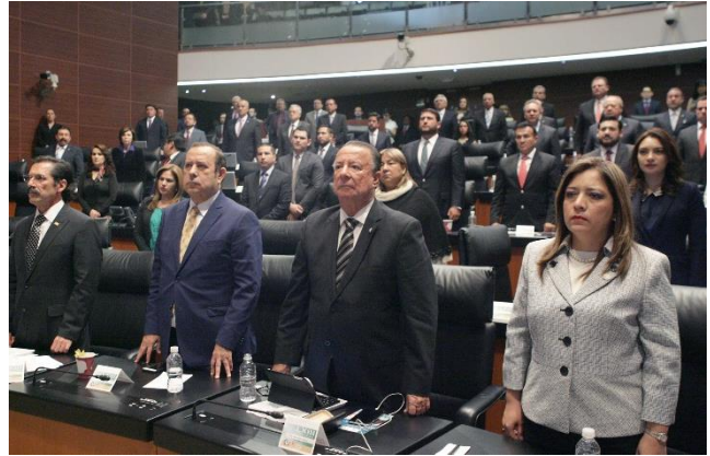
Sesión Ordinaria. 15 de marzo de 2016.