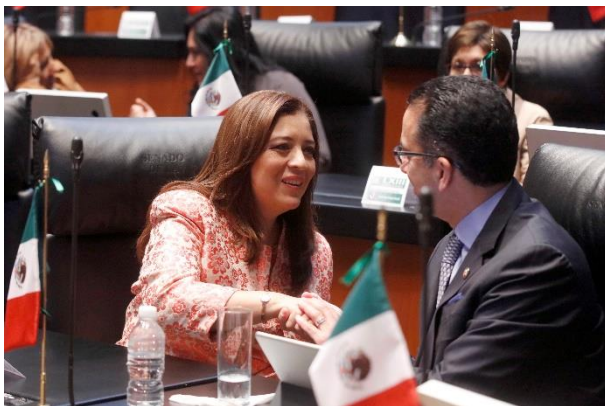
Sesión Ordinaria. 7 de septiembre de 2017.