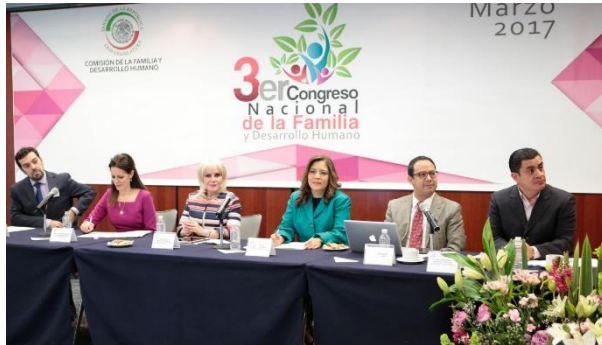
Tercer Congreso Nacional de Familia. Marzo de 2017