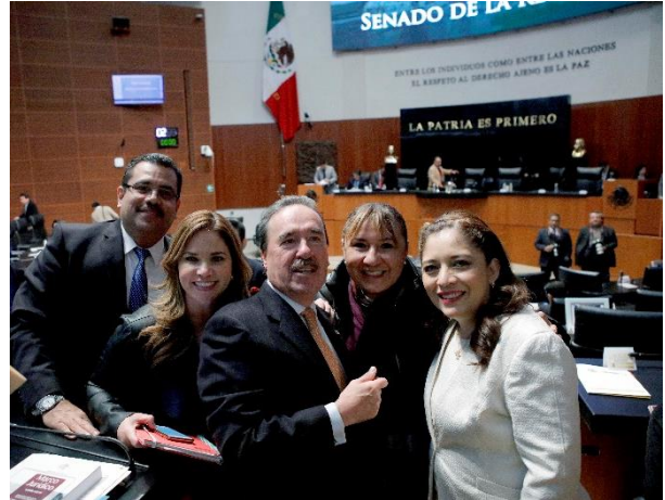
Sesión Ordinaria. 12 de diciembre de 2017.