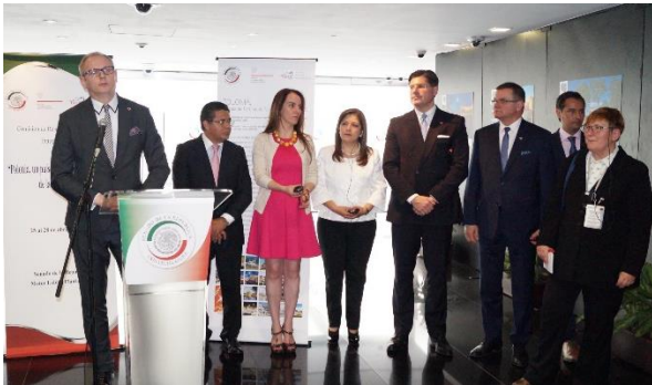
Inauguración de la Exposición Polonia. Abril de 2017.