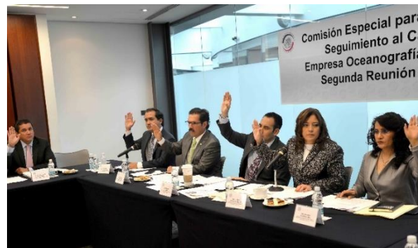
Reunión de Trabajo. 7 de mayo de 2014