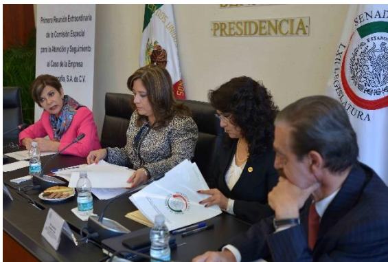
Reunión de Trabajo. 3 de junio de 2014