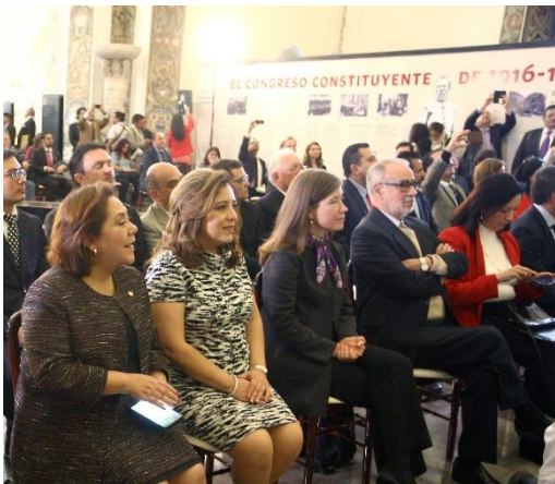
Inicio de los Festejos para la Conmemoración del Centenario de la Constitución Política de los Estados Unidos Mexicanos de 1917. Febrero de 2016.