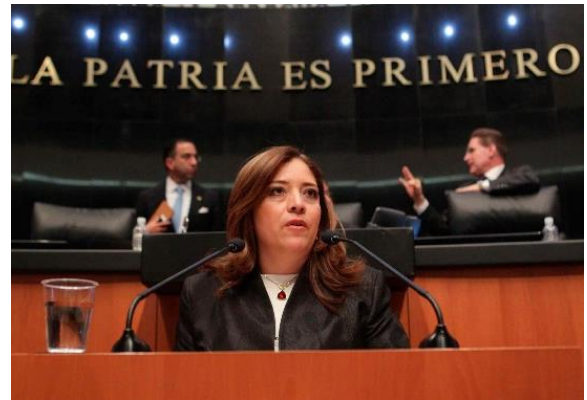
Sesión Ordinaria. 28 de abril de 2015.