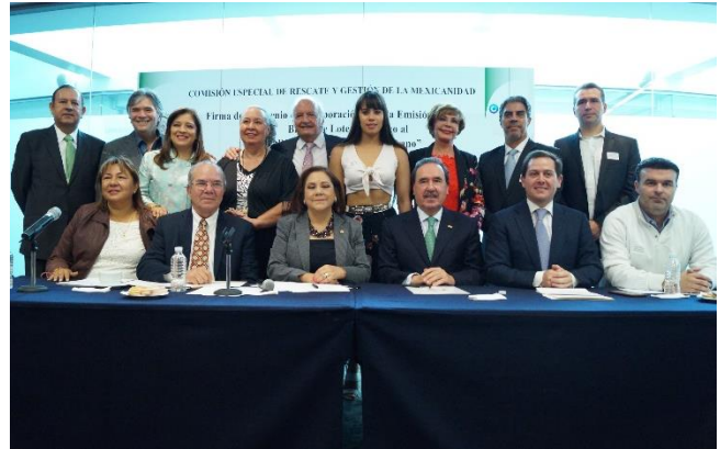
Firma del Convenio de Colaboración para la Emisión de un Billeto de Lotería alusivo al Día Nacional del Cine Mexicano. Junio 2017