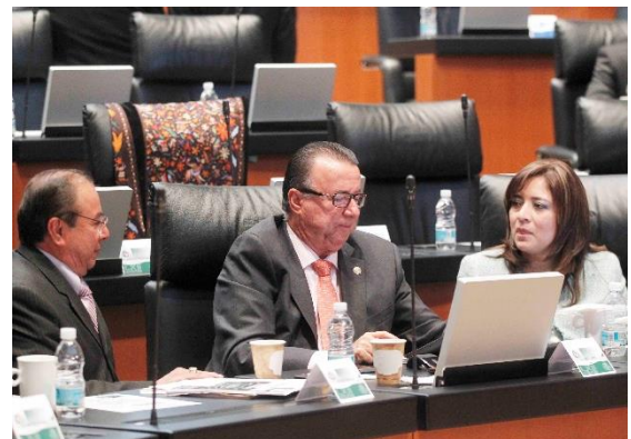
Sesión Ordinaria. 20 de noviembre de 2013.