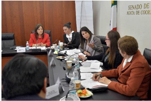
Reunión de Trabajo. 25 de noviembre de 2013.