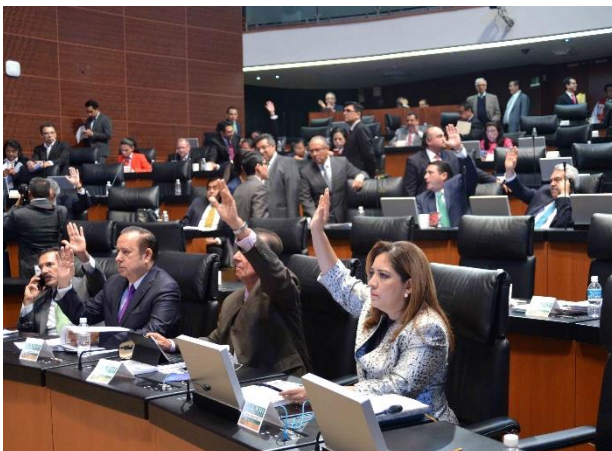
Sesión Ordinaria. 19 de noviembre de 2015.