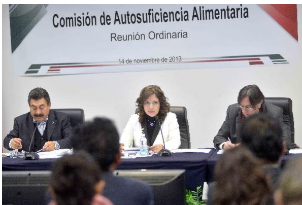
Reunión Ordinaria. 14 de noviembre de 2013.