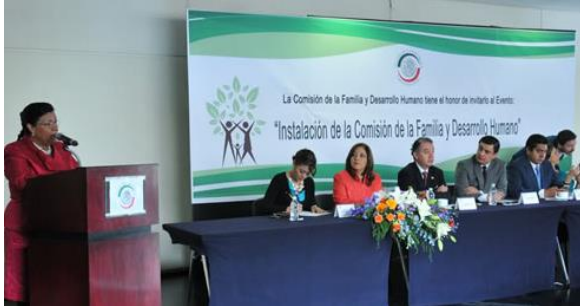
Reunión de Instalación. 12 de junio de 2014.