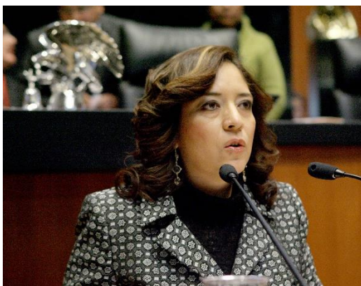
Sesión Ordinaria. 2 de diciembre de 2013.