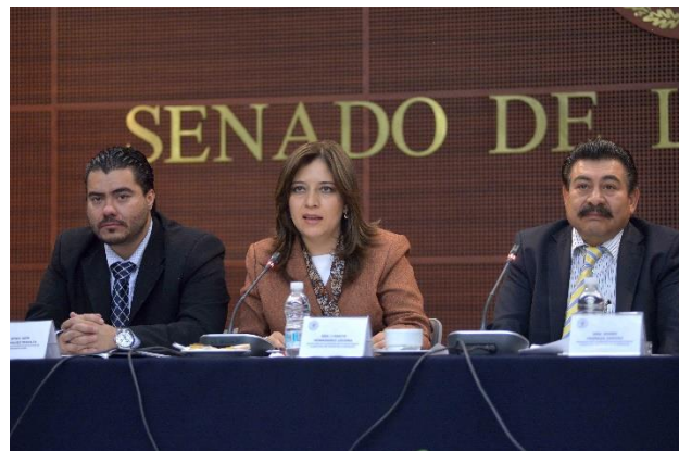
Reunión Ordinaria. 20 de febrero de 2014.