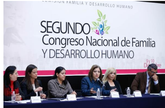
Segundo Congreso Nacional de Familia. Diciembre de 2015