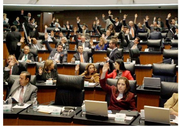
Sesión Ordinaria. 26 de febrero de 2014.