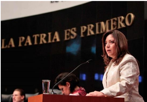
Sesión Ordinaria. 30 de septiembre de 2014.