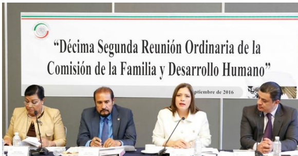
12ª Reunión Ordinaria. 22 de septiembre de 2016