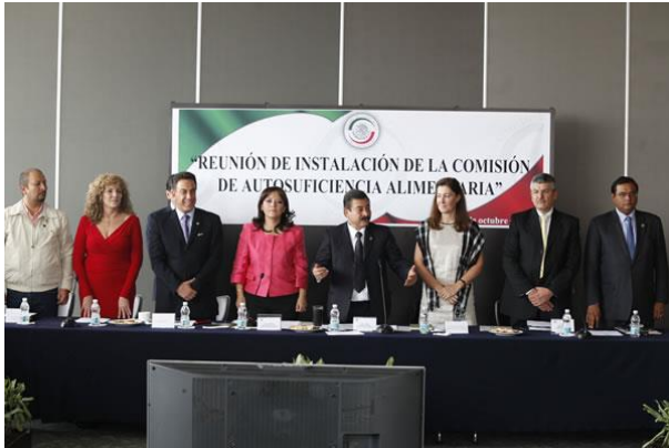
Reunión de Instalación. 10 de octubre de 2012.