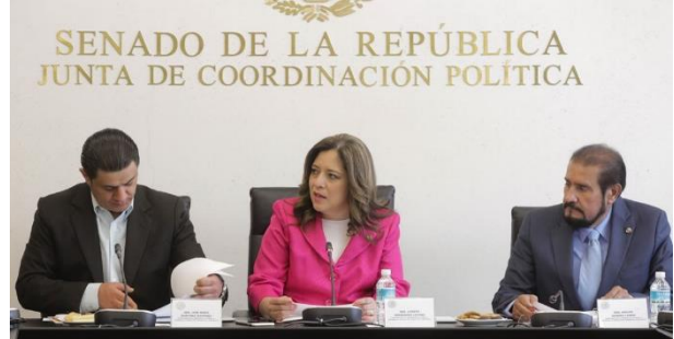
10ª Reunión Ordinaria. 13 de abril de 2016.