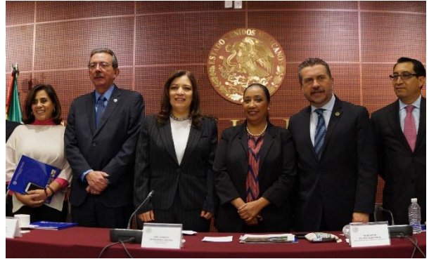
Foro "Desperdicio y Perdida de Alimentos en México: Retos y Soluciones". 16 de noviembre de 2017.