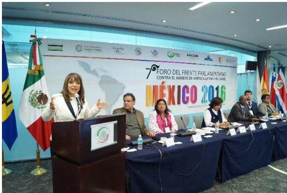
7° Foro del FPH. 10 de noviembre de 2016.