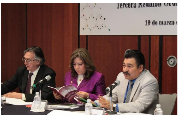
Reunión Ordinaria. 19 de marzo de 2015.