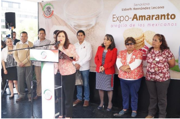
Expo-Amaranto. 3 de abril de 2018.