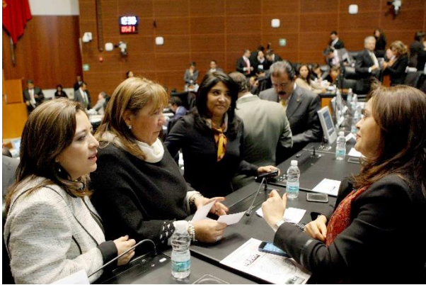
Sesión Ordinaria. 11 de febrero de 2014.