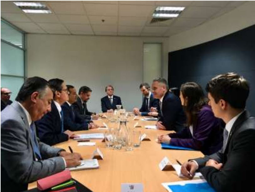
Reunión de la delegación mexicana con el Sr. Fletcher Tabuteau.

políticas del Estado mexicano en favor del libre comercio. Recordaron que México fue el primer país en ratificar el CPTPP. Ambas partes coincidieron en apoyar el comercio y la inversión, así como en avanzar en la aprobación y entrada en vigor del CPTPP y expresaron su apoyo para que Nueva Zelanda sea Miembro Asociado en la Alianza del Pacífico este mismo año. Comentaron sobre el interés de todas las fuerzas políticas por lograr un acuerdo satisfactorio durante la renegociación del Tratado de Libre Comercio de América del Norte (TLCAN). Finalmente, los legisladores reconocieron las oportunidades que existen en la industria de innovación y creatividad que hay en Nueva Zelanda en el cine, los videojuegos, el software y de expandir el comercio a servicios y manufacturas.