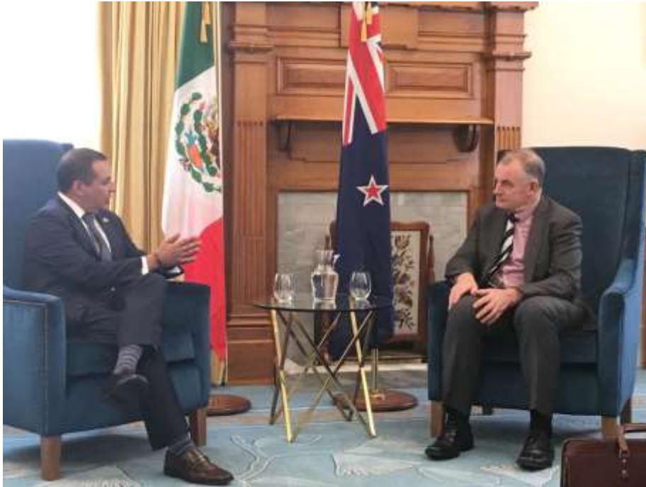
El Senador Ernesto Cordero con el Presidente del Parlamento de Nueva Zelanda, M.H. Sr. Trevor Mallard.