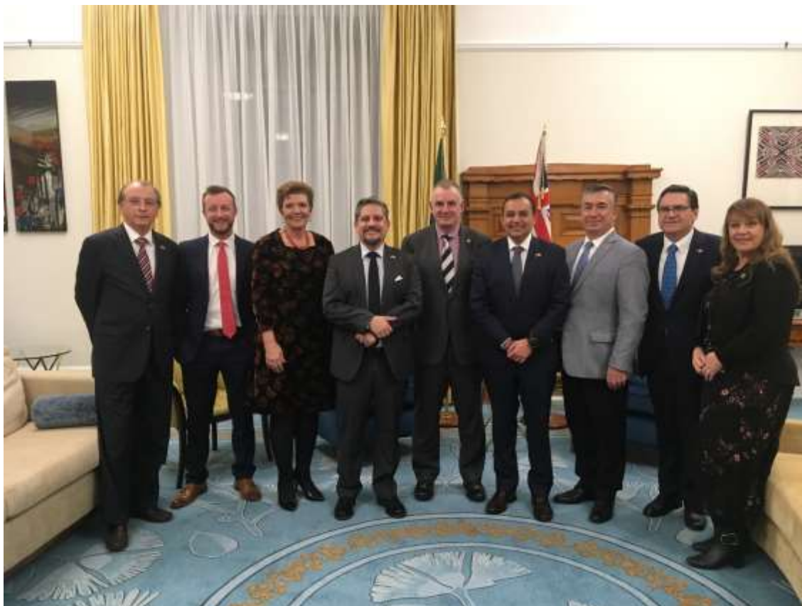
La delegación mexicana con el Presidente M.H. Sr. Trevor Mallard y la Vicepresidenta, Sra. Anne Tolley del Parlamento de Nueva Zelanda,

INFORME QUE PRESENTA EL PRESIDENTE DE LA MESA DIRECTIVA DEL SENADO, SENADOR ERNESTO CORDERO ARROYO A NOMBRE DE LA DELEGACIÓN MEXICANA INTEGRADA POR LOS SENADORES LUIS HUMBERTO FERNÁNDEZ FUENTES; JOSÉ DE JESÚS SANTANA GARCÍA Y MANUEL CÁRDENAS FONSECA, QUIENES PARTICIPARON EN LA VISITA OFICIAL A NUEVA ZELANDIA.