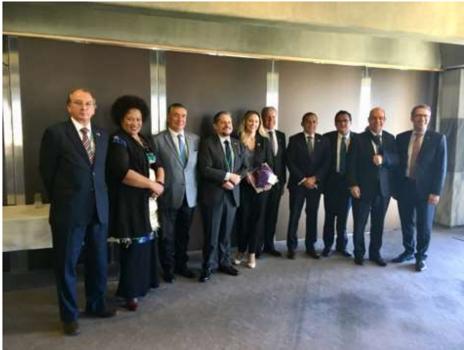
La delegación mexicana con los miembros del Grupo de Amistad de Nueva Zelanda con América Latina.

Los legisladores comentaron sobre la importancia de la aprobación del CPTPP y de la incorporación de Nueva Zelanda a la Alianza del Pacífico. Hablaron también sobre la renegociación del Tratado de Libre Comercio de América del Norte (TLCAN), los retos y las perspectivas.