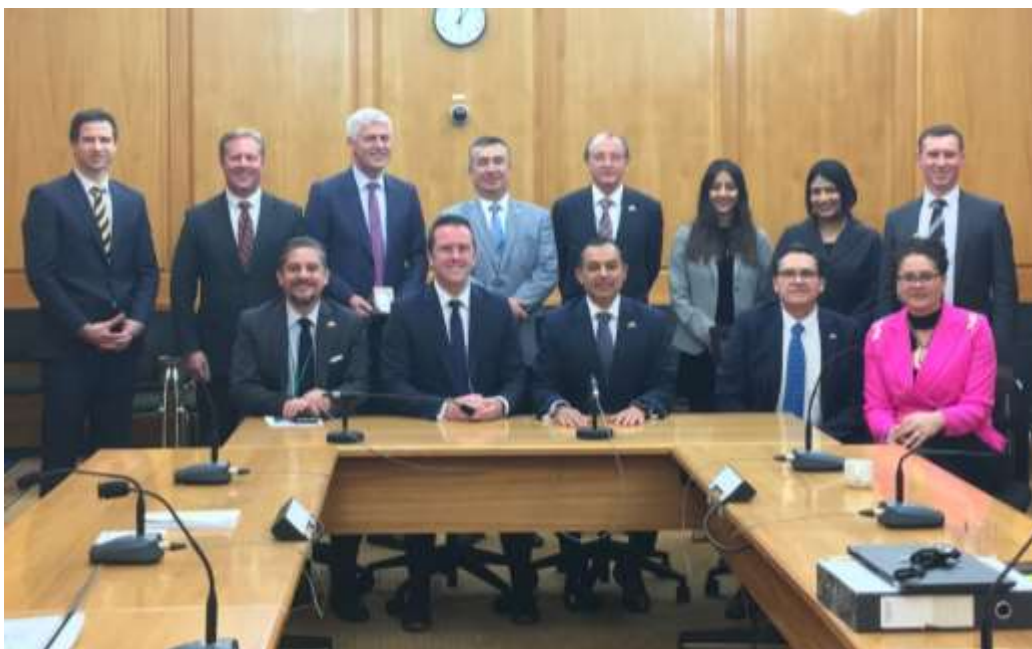
La delegación mexicana durante la reunión con los miembros del Comité Selecto de Relaciones Exteriores, Defensa y Comercio.

El Comité Selecto de Relaciones Exteriores, Defensa y Comercio es la responsable de aprobar el CPTPP y actualmente se encuentra en su fase de consultas.