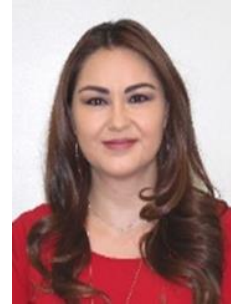
Sen. Geovanna del Carmen Bañuelos De la Torre