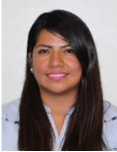
Sen. Indira Kempis Martínez