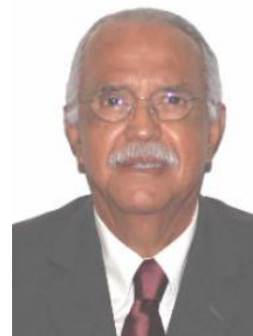
Sen. Miguel Ángel Navarro Quintero