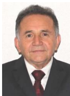
Sen. José Luís Pech Vázquez