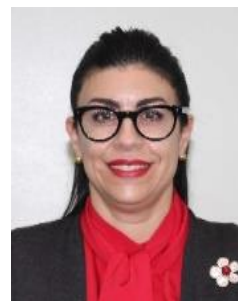
Sen. Vanessa Rubio Márquez