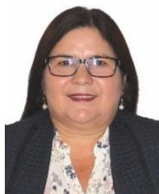
Sen. Imelda Castro Castro