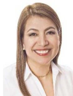
Sen. María Guadalupe Saldaña Cisneros