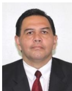
Sen. Cruz Pérez Cuellar