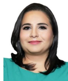
Sen. Mayuli Latifa Martínez Simón