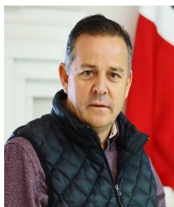
Sen. Gerardo Novelo Osuna