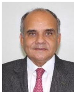
Sen. Manuel Añorve Baños