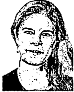
Dip. María Marcela Torres Peimbert Secretaria