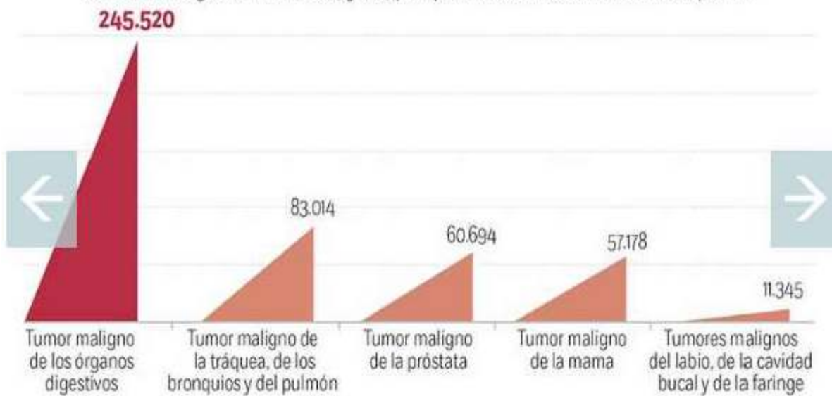
Defunciones registradas entre 2005 y 2015 por tipos de cáncer asociados con el tabaquismo

3