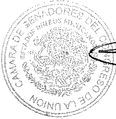
SEN. MÓNICA FERNÁNDEZ BALBOA Presidenta

SALÓN DE SESIONES DE LA HONORABLE CÁMARA DE SENADORES.- Ciudad de México, a 29 de junio de 2020.