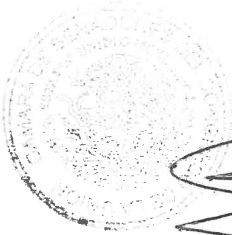
SEN. MÓNICA FERNÁNDEZ BALBOA Presidenta

Ciudad de México, a 19 de marzo de 2020.