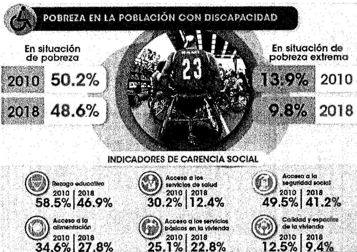
Gráfica 2. Situación de población con discapacidad.

Asimismo, la Encuesta Nacional de Ingresos y Gastos de los Hogares (ENIGH) 2018, señala que el ingreso promedio trimestral monetario de las personas con discapacidad es de 11,438 pesos; el de las personas con dificultad para ver, aun usando lentes fue de 11,260 pesos, mientras que el de las personas con alguna dificultad para poner atención o aprender cosas sencillas se situó en 6,209 pesos mientras que la percepción para personas sin discapacidad se encuentra en un promedio de 18,663 17 como puede verse en la siguiente tabla: