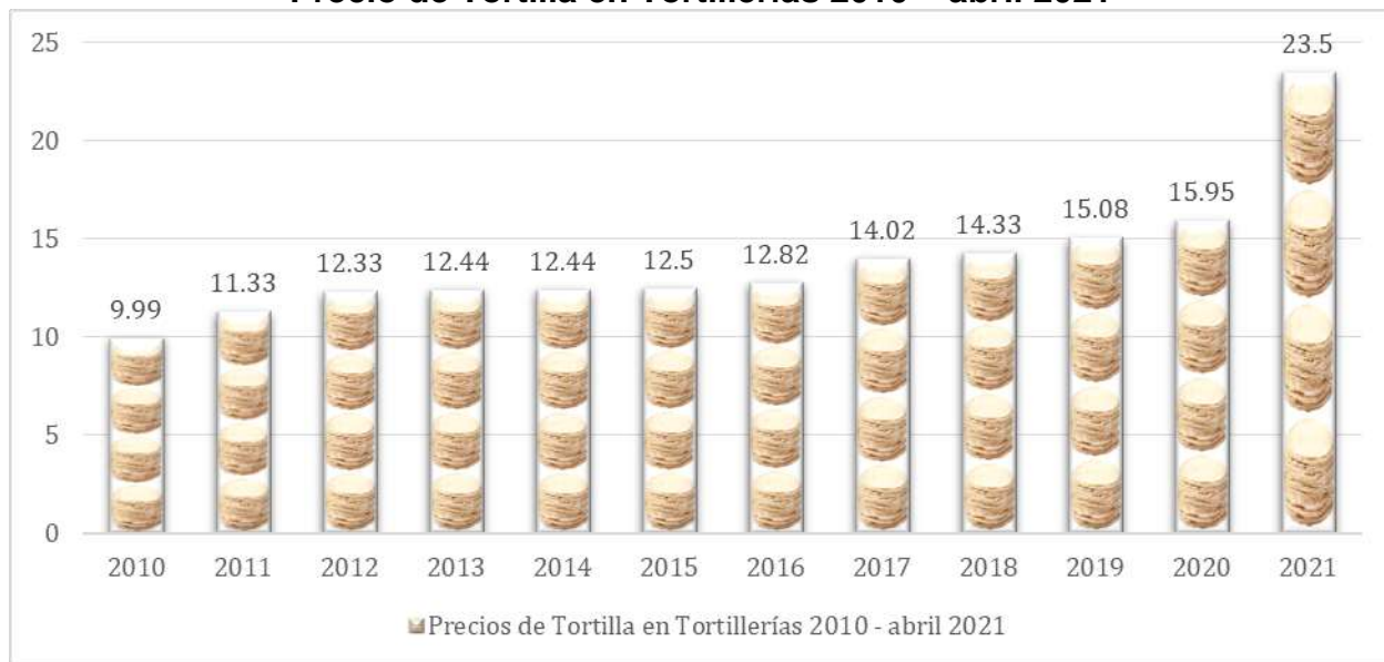
Gráfica 2 Precio de Tortilla en Tortillerías 2010 – abril 2021