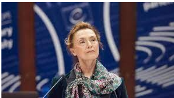
Marija Pejcinovic Buric, Secretaria General

La secretaria general Marija Pejcinovic Buric, confirmo que se han propuesto modificaciones al plan de acción en Ucrania para responder a las consecuencias de la agresión rusa. Expresó su solidaridad con el pueblo de ucraniano y reconoció su valor.