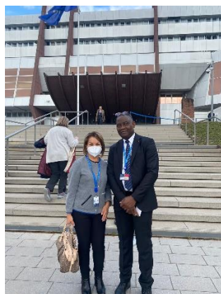
Sede del Consejo de Europa

Una alianza estratégica del Tratado de Lisboa con la Unión Europea, implica diálogo permanente y abierto, cooperación jurídica, programas de colaboración y fondeo para fortalecer los derechos humanos, con mecanismos de control y supervisión.