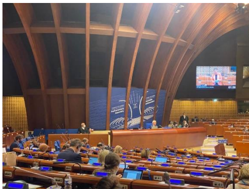
Salón de Sesiones

Se presenta tortura, maltrato y violencia sexual a periodistas, activistas y defensores de derechos humanos que huyen de la guerra. Se requiere de atención de servicios de salud y salud reproductiva, de protección infantil, y de un proceso de reunificación para los niños. Hay violencia despiadada bajo control de las tropas rusas y civiles asediados por ellos.