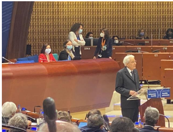
Sergio Mattarella Presidente de la República Italiana

La expulsión de la Federación de Rusia del Consejo de Europa se ha vuelto inevitable debido a los crímenes que ha cometido en Ucrania, ya que no solo ha invadido ilegalmente el país si no que ha continuado esta agresión en abierta violación a los derechos.