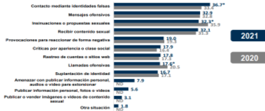
Distribución porcentual de las situaciones de ciberacoso experimentadas por las mujeres de 12 años y más en los últimos 12 meses 1

La violencia digital contra las mujeres representa un obstáculo para el ejercicio del derecho a la información y al acceso seguro a las telecomunicaciones, por tanto, prevenirla nos permite avanzar hacia un ejercicio igualitario entre mujeres y hombres que además contribuye al goce y disfrute de otros derechos humanos, por ejemplo: la recreación, la educación, la libertad, la seguridad y el derecho de todas las personas a una vida libre de violencia. Para prevenir la violencia digital contra las mujeres es necesario realizar acciones que provoquen cambios y reflexiones en torno a las ideas que tenemos sobre cómo ser mujer u hombre en nuestra sociedad, eliminando viejas creencias sobre los roles y estereotipos de género y construyendo nuevas formas de relacionarnos, evitando que mujeres, niñas y adolescentes sean víctimas de alguna