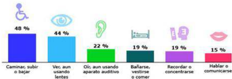
Porcentaje de la población con discapacidad según dificultad en la actividad 2020

Nota: La suma de porcentajes es mayor a 100 por la población que presenta más de una dificultad.