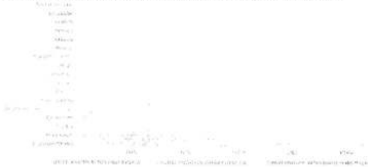
Gráfica 3. Ventas de vehículos híbridos y eléctricos por entidad, 2021.