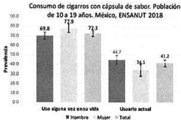
Consumo de cigarrillos combustibles con cápsula de sabor. Adolescentes de 10 a 19 años. ENSANUT 2018.