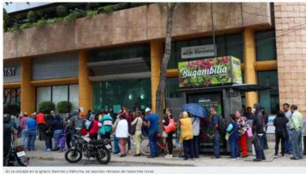
En la sucursal de Ignacio Ramírez y Reforma, se reportan retrasos de hasta tres horas

En la sucursal de Ignacio Ramírez, esquina con avenida Reforma, varios adultos mayores informaron que, ante la espera, ha habido discusiones, gritos en insultos a los trabajadores del banco