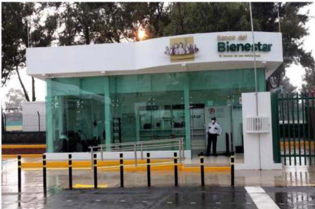
La ASF señaló un manejo de irregularidades y anomalías en diversos contratos millonarios del Banco del Bienestar con Sixsigma Networks.

Charlene Domínguez Cd. de México (21 febrero 2023).- 16:49 hrs