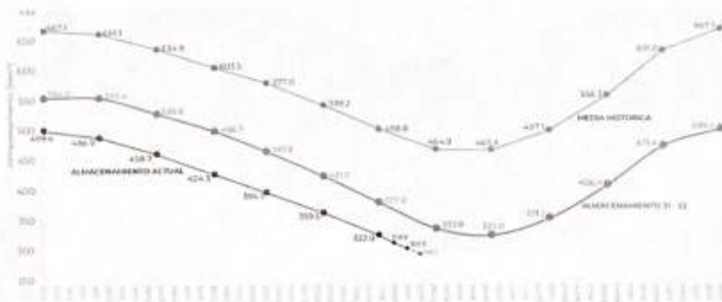
IMAGEN 2. Comparativa entre el almacenamiento de agua del Sistema Cutzamala entre el promedio histórico, el año 2021-2022 y el actual. Publicado en por CONAGUA en https://www.gob.mx/conagua/prensa/informe-semanal-del-comite-tecnico-de-operacion-de-obras-hidraulicas-334035?idiom=es (consultado el 25 de mayo de 2023).