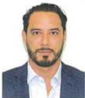
Sen. Raúl Paz Alonzo Integrante de la Comisión de Energía