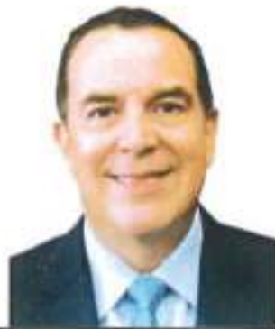
Sen. Ernesto Pérez Astorga Integrante de la Comisión de Energía