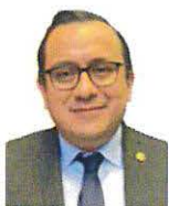
SEN. JOSÉ ANTONIO AGUILAR CASTILLEJOS Integrante GP MORENA