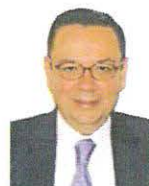
SEN. GERMÁN MARTÍNEZ CÁZARES Integrante SIN GRUPO