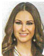
SEN. GEOVANNA BAÑUELOS DE LA TORRE Integrante GP PT