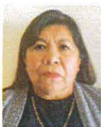
SEN. MARÍA GRACIELA GAITÁN DÍAZ Integrante GP PVEM