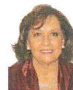
SEN. MARTHA LUCÍA MICHER CAMARENA Integrante GP MORENA