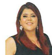
SEN. ELVIA MARCELA MORA ARRELLANO Integrante GP PES