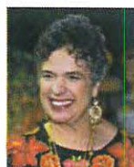
SEN. BEATRIZ PAREDES RANGEL Integrante GP PRI