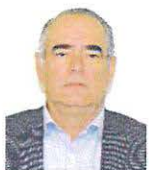
SEN. JULEN REMENTERIA Integrante GP PAN