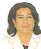
SEN. LILIA MARGARITA VALDEZ MARTÍNEZ Integrante GP MORENA