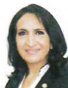
SEN. ROSA ELENA JIMÉNEZ ARTEAGA Integrante GP MORENA