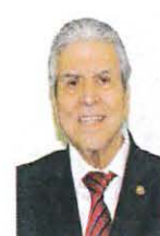
SEN. CARLOS HUMBERTO ACEVES DEL OLMO GP PRI