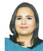
SEN. MAYULI LATIFA MARTÍNEZ SIMÓN Integrante GP PAN