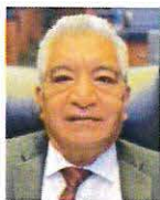
SEN. SAÚL LÓPEZ SOLLANO Integrante GP MORENA