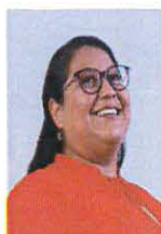
SEN. M. CITLALLI HERNÁNDEZ MORA GP MORENA