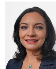
Sen. Mely Romero Celis Integrante