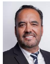
Sen. Juan Carlos Loera de la Rosa Integrante