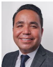
Sen. Heriberto Aguilar Castillo Integrante