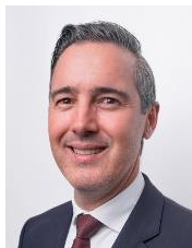
Sen. José Ramón Gómez Leal Integrante