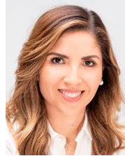
Sen. Susana Zatarain García Presidenta