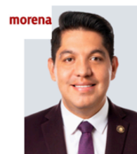
Sen. Emmanuel Reyes Carmona