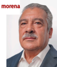
Sen. Raúl Morón Orozco