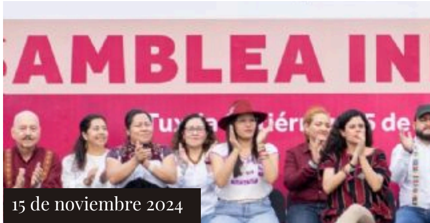
Asamblea informativa del Comité Ejecutivo Nacional de Morena Presidido por Luisa María Alcalde