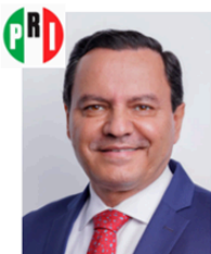
Sen. Ángel García Yáñez