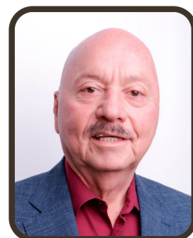
Sen. José Manuel Cruz Castellanos Presidente de la Comisión de Salud

La Comisión de Salud del Senado de la República constituye el órgano especializado responsable de analizar, dictaminar y supervisar los asuntos vinculados al desarrollo y regulación de las políticas públicas en materia sanitaria. En la actualidad, dicha Comisión se encuentra integrada por 21 miembros, quienes, en representación de los distintos grupos parlamentarios, desempeñan sus funciones bajo los principios de pluralidad, colegialidad y responsabilidad legislativa, con el propósito de fortalecer el marco normativo que rige el Sistema Nacional de Salud.