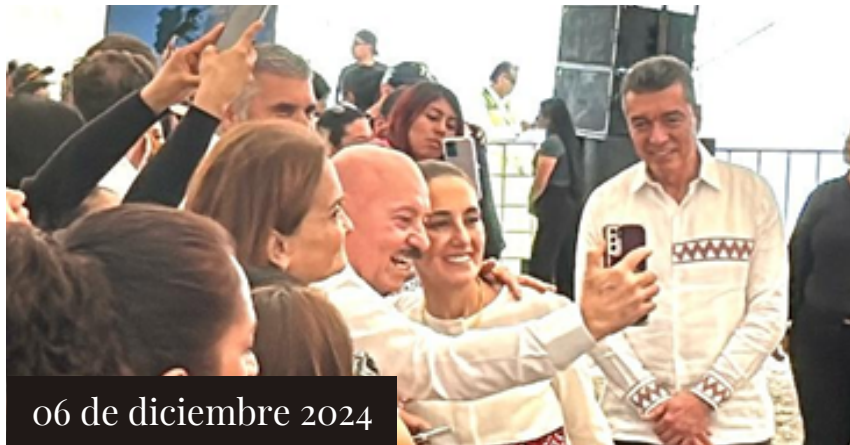
Inauguración de la autopista Tuxtla-San Cristóbal de las Casas que presidió la Presidenta Claudia Sheinbaum y el Gobernador Rutilio Escandón.

AUTOPISTA TUXTLA - SAN CRISTÓBAL DE LAS CASAS, CHIAPAS