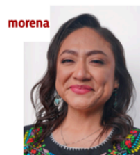
Sen. Karina Isabel Ruiz Ruiz