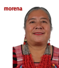
Sen. Luisa Cortés García