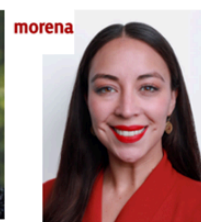
Sen. Julieta Andrea Ramírez Padilla