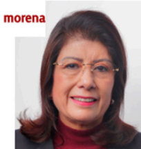
Sen. Mariela Gutiérrez Escalante