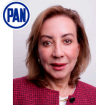
Sen. María Guadalupe Murguía Gutiérrez