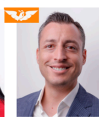
Sen. Luis Donaldo Colosio Riojas