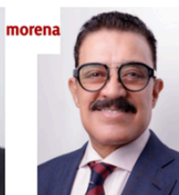
Sen. Carlos Lomelí Bolaños