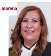
Sen. Blanca Judith Díaz Delgado