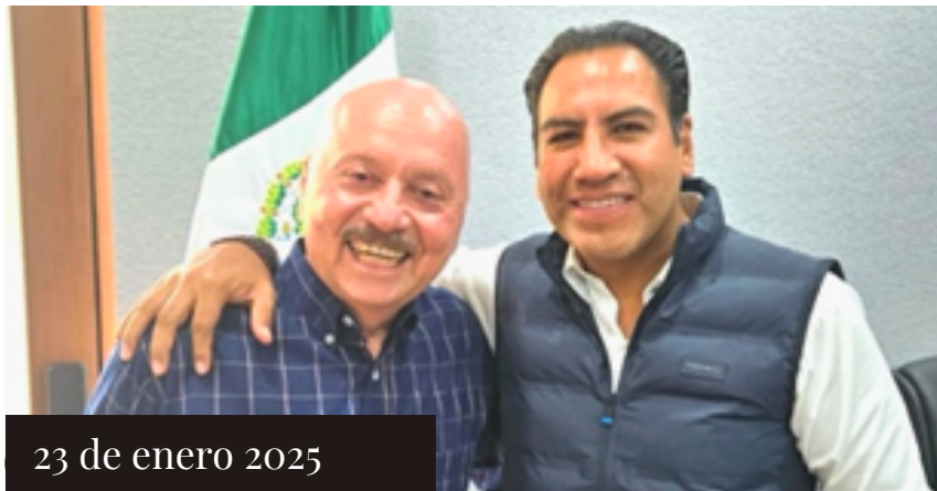
Reunión con el Gobernador de Chiapas, Eduardo Ramírez Aguilar