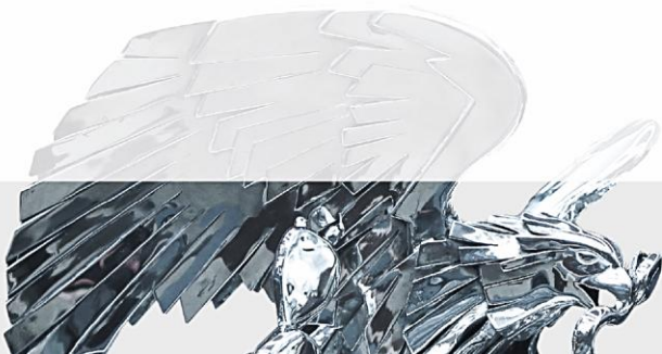
Sen. Susana del Carmen Zatarain García