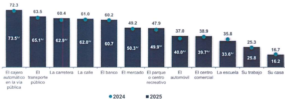
Gráfica 20 Población que manifiesta sentirse insegura en espacios públicos o privados 2024 y 2025 (porcentaje)

Notas: La persona informante pudo haber elegido más de una respuesta. Se refiere al periodo marzo y abril de cada año. v Cambio estadísticamente significativo con respecto al año anterior. Fuente: INEGI. Encuesta Nacional de Victimización y Percepción sobre Seguridad Pública (ENVIPE), 2024 y 2025.